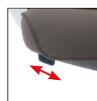
Alzo seduta Seat height adjustment