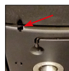
Regolazione eventuale intensità di oscillazione (con chiave in dotazione) Tilting tension adjustment (hex key included), if necessary