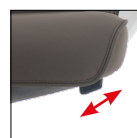
Blocco e sblocco oscillazione (3 posizioni) Tilt movement (3 positions)