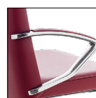
Bracciolo alluminio con soprabracciolo imbottito Aluminium arm with padded top