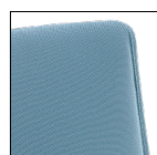
Sedile/schienale lisci Flat seat/backrest