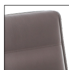
Sedile/schienale con cuciture lineari Linear stitching seat/backrest